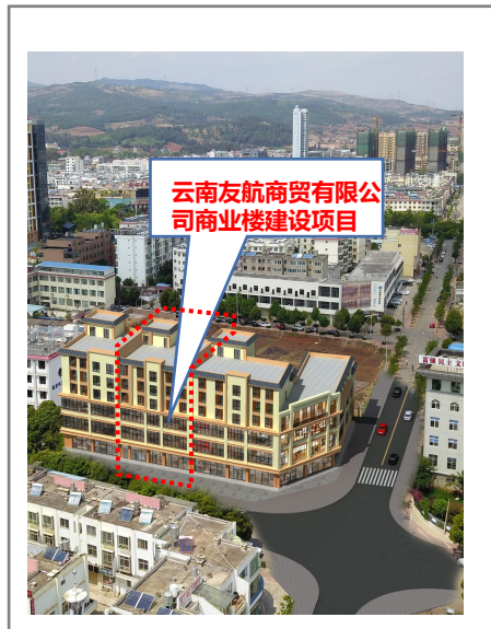
变更后鸟瞰效果图