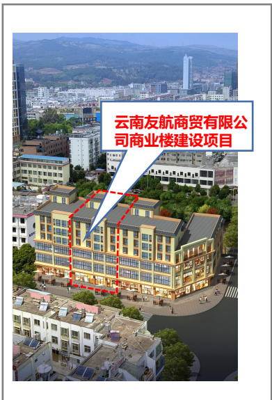
变更前鸟瞰效果图