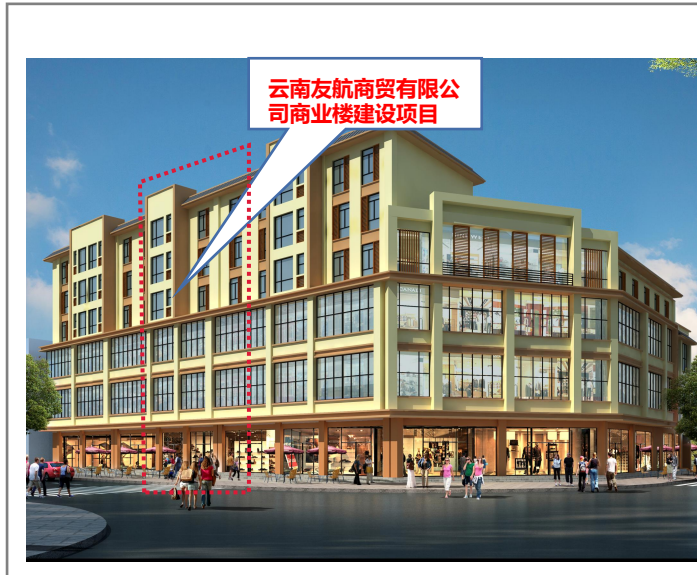
变更前重要景观透视效果图