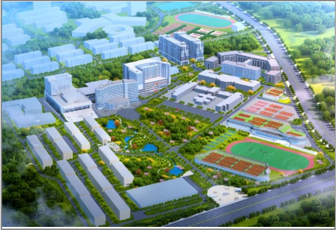
学生服务中心效果图