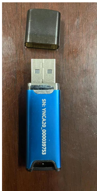
用人单位数字证书外观图

昆明市公共就业服务的数字证书外观如下图，根据《中华人民共和国电子签名法》、《昆明市互联网政务应用服务安全平台电子认证服务管理办法》等规定，现由第三方云南省数字证书认证中心有限公司（简称云南 CA 公司）提供制发和管理等服务。